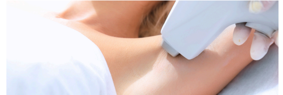
美容皮膚科・レーザー治療・脱毛などの施術時に

本研修はeラーニング形式で実施され、ガイドラインに基づいた理論の理解から、機器の組立・操作、緊急時対応まで段階的に習得できる体系的なカリキュラムをご用意しています。シミュレーションを通じて実践力を磨くこともでき、現場での即戦力育成につながります。オンライン形式のため、勤務時間内に分割して受講することも可能で、日常業務と両立しながら効率的に学べます。学習履歴はLMSにより記録され、全カリキュラムを修了した受講者には修了証が発行されるため、組織としても安心して導入体制を構築することができます。