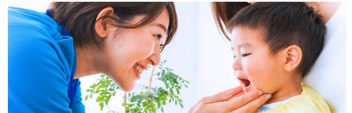
歯科治療に対して強い恐怖心を抱く患者さまへ