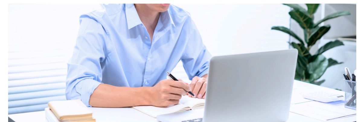
Eラーニングを使うので隙間時間で学べる